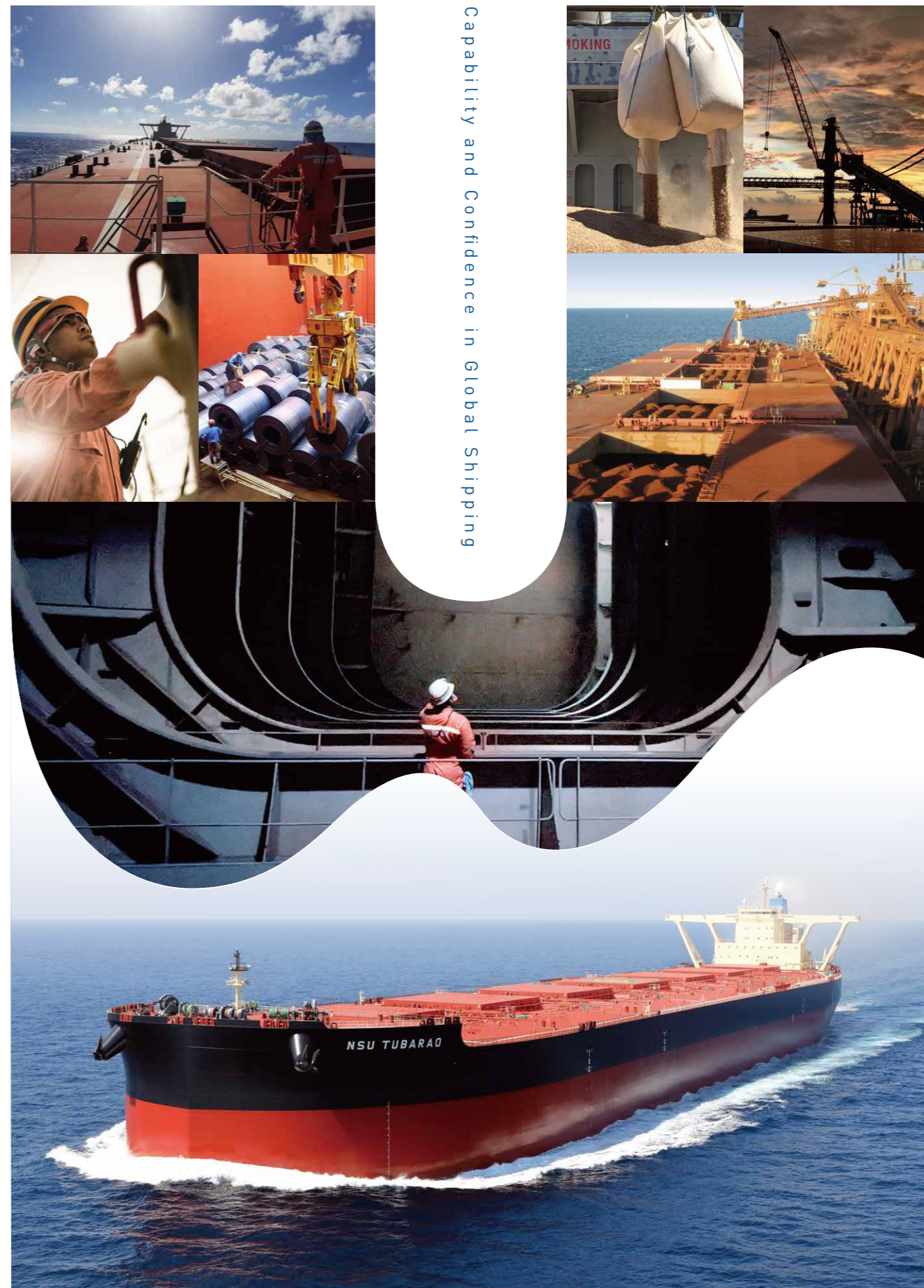
Capability and Confidence in Global Shipping