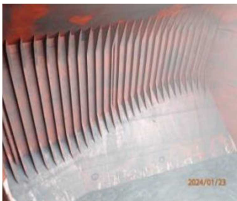
〈ホールドクリーニング前（弊社管理船）〉