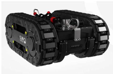
〈ホールドクリーニングロボット〉