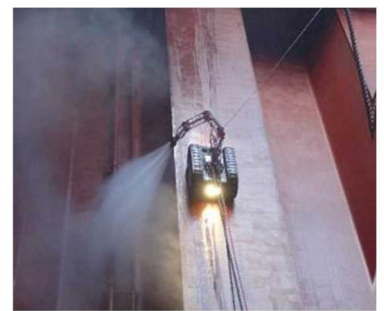
〈弊社管理船のホールド内を高圧水洗浄するロボット〉